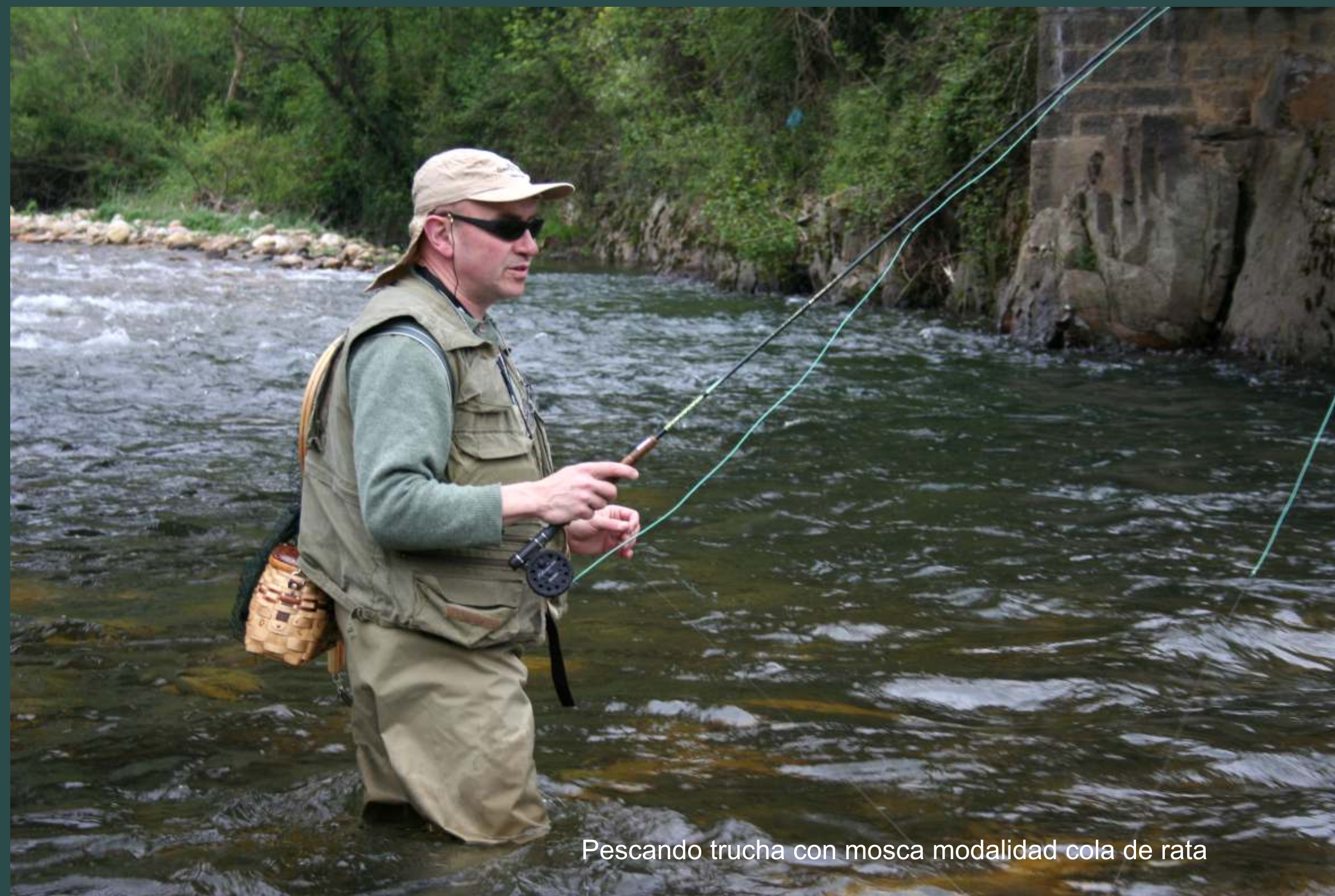
Pescando trucha con mosca modalidad cola de rata