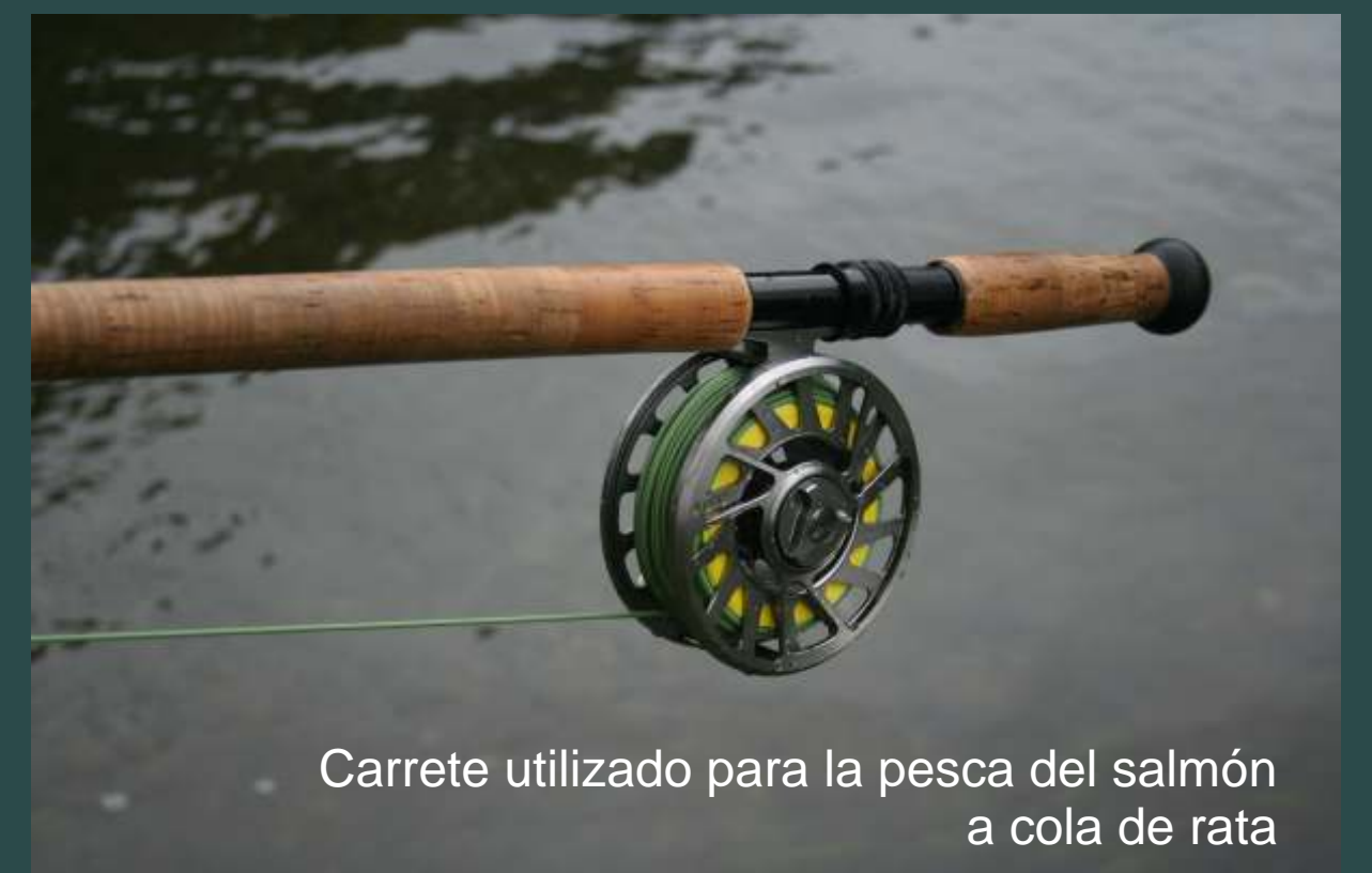
Carrete utilizado para la pesca del salmón a cola de rata

Para trucha se utilizan habitualmente cañas de una mano, para líneas entre el 3 y el 7. Para salmón es más habitual utilizar cañas de dos manos, más largas que las de trucha y para líneas entre el 8 y el 11.