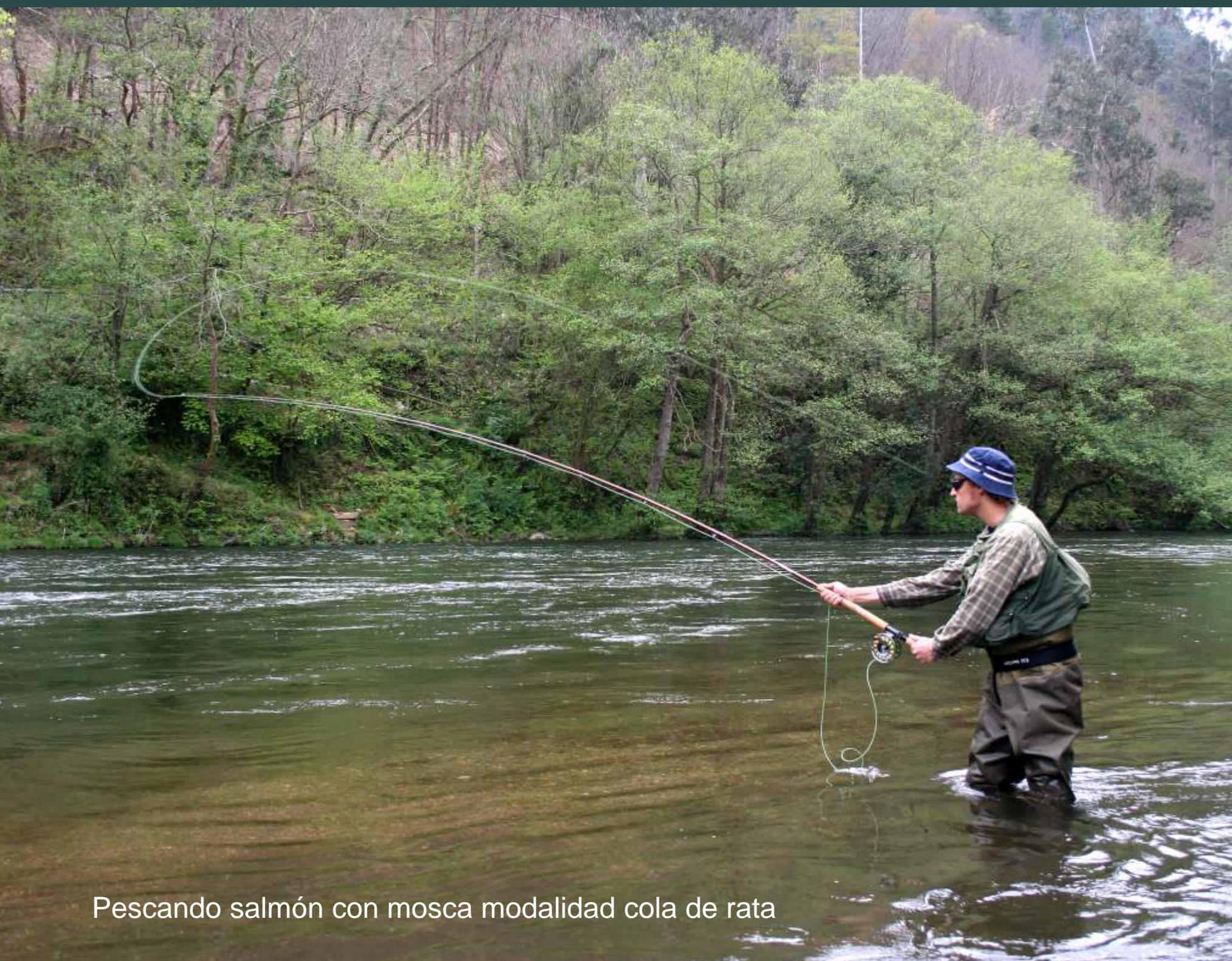
Pescando salmón con mosca modalidad cola de rata