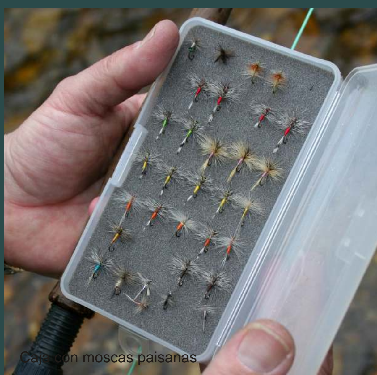
cañas con moscas paisanas