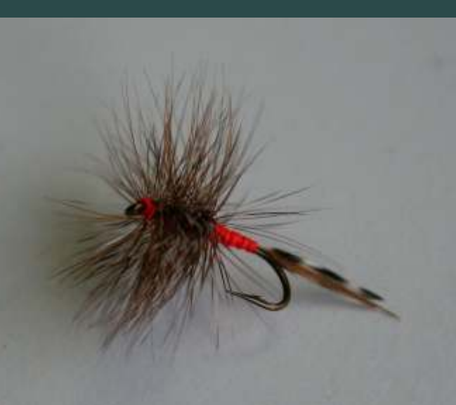
Típicas moscas paisanas

Se lanza la mosca a las zonas donde creemos que puede estar la trucha, batiendo primero la orilla más cercana, después las corrientes situadas en la parte central del río y por último la orilla opuesta, repitiendo la operación río arriba, en dirección contraria a la corriente.