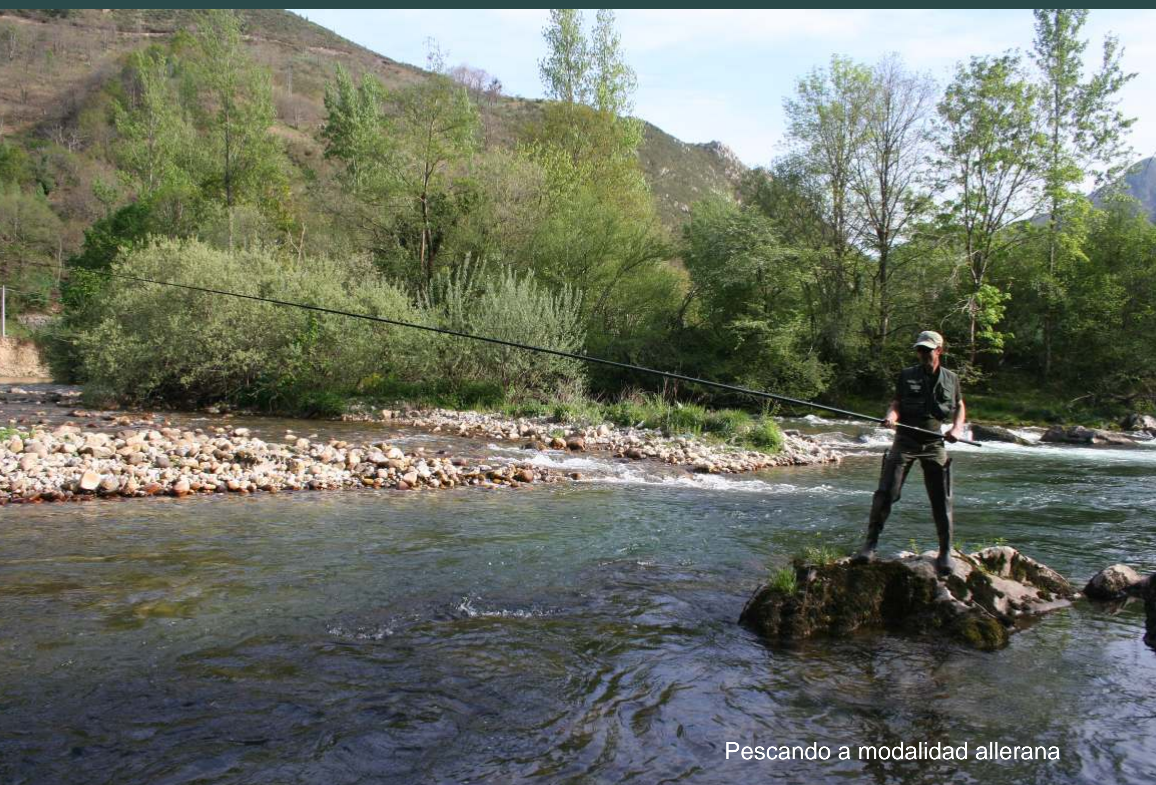
Pescando a modalidad allerana