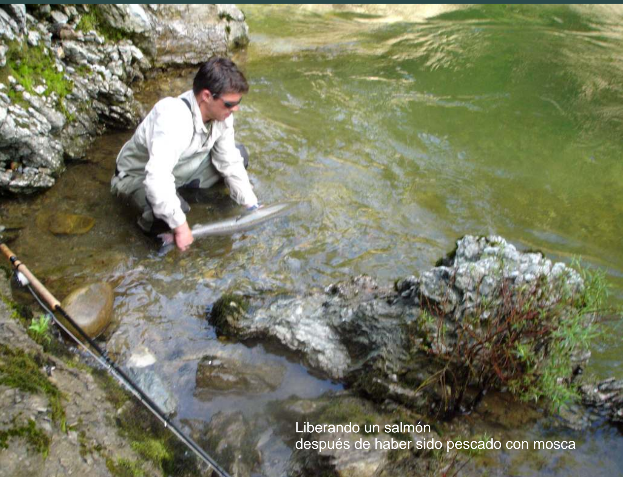
Liberando un salmón después de haber sido pescado con mosca