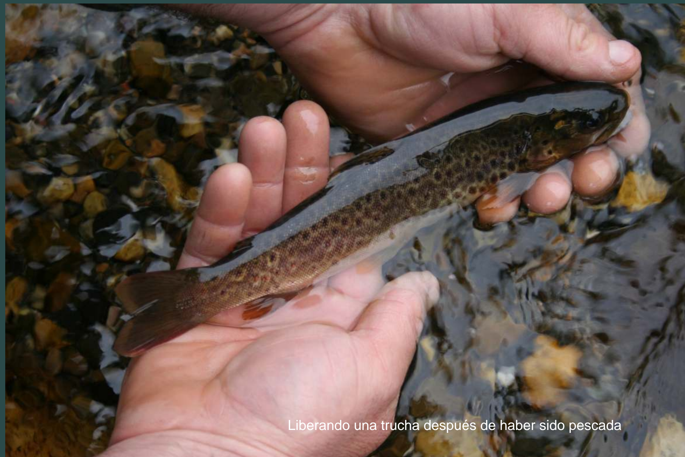
Liberando una trucha después de haber sido pescada