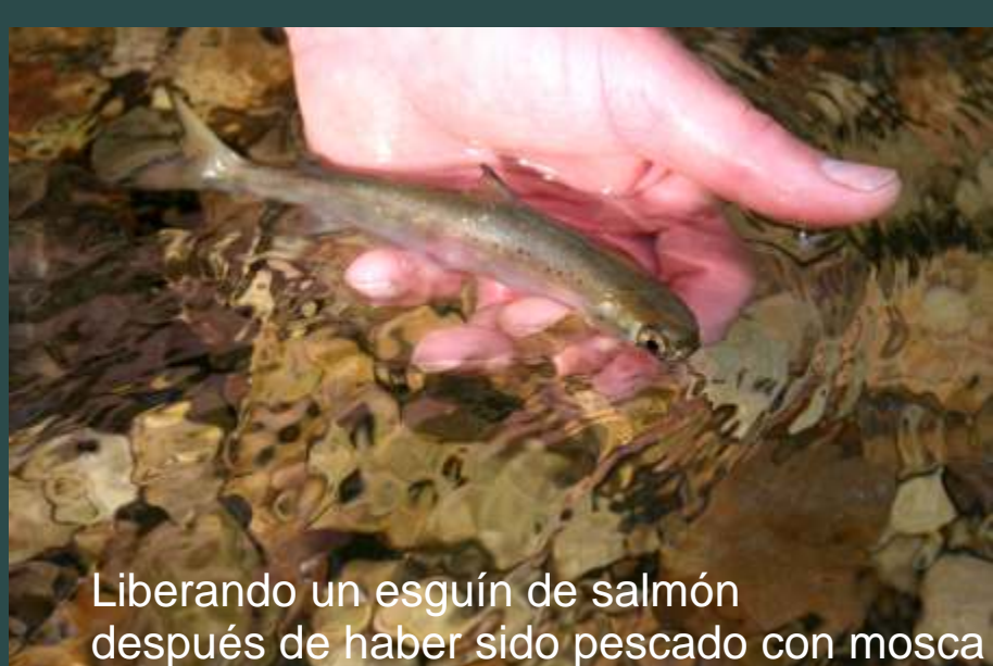
Liberando un esguín de salmón después de haber sido pescado con mosca

La pesca con mosca es muy poco lesiva para el pez. Permite practicar la pesca sin muerte y devolver vivos los peces al río sin causarles daños importantes.